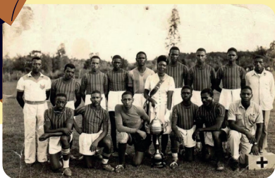
Um dos times que participou da Liga Nacional de Futebol Porto-Alegrense.

O racismo é uma marca profunda da sociedade brasileira e se manifesta em diferentes espaços da vida social: nas escolas, nos locais de trabalho, na política e, também, no esporte. Mesmo sendo um espaço de integração e superação, o esporte carrega as mesmas estruturas discriminatórias da sociedade. No futebol, isso se torna visível nas ofensas racistas vindas das arquibancadas, nas dificuldades enfrentadas por jogadores negros para alcançar posições de destaque e na falta de representatividade em cargos de comando dentro dos clubes. O racismo no futebol é um reflexo de uma estrutura social que ainda exclui o negro, e que se manifesta tanto de forma individual, através de atitudes e falas racistas, quanto de forma coletiva, nas dinâmicas das torcidas e nas imagens que o esporte reforça.